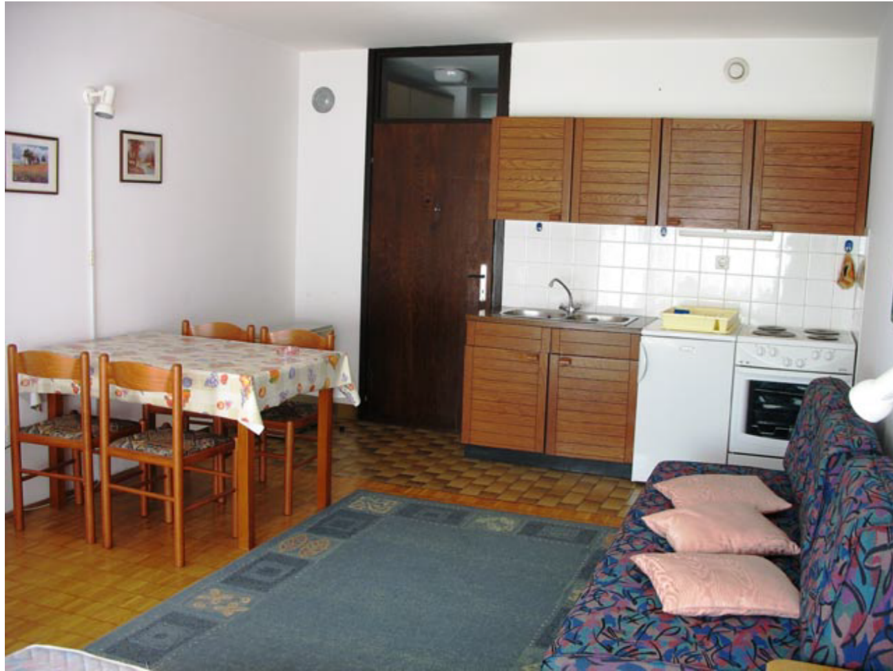
Apartmajska ponudba v občini Bovec