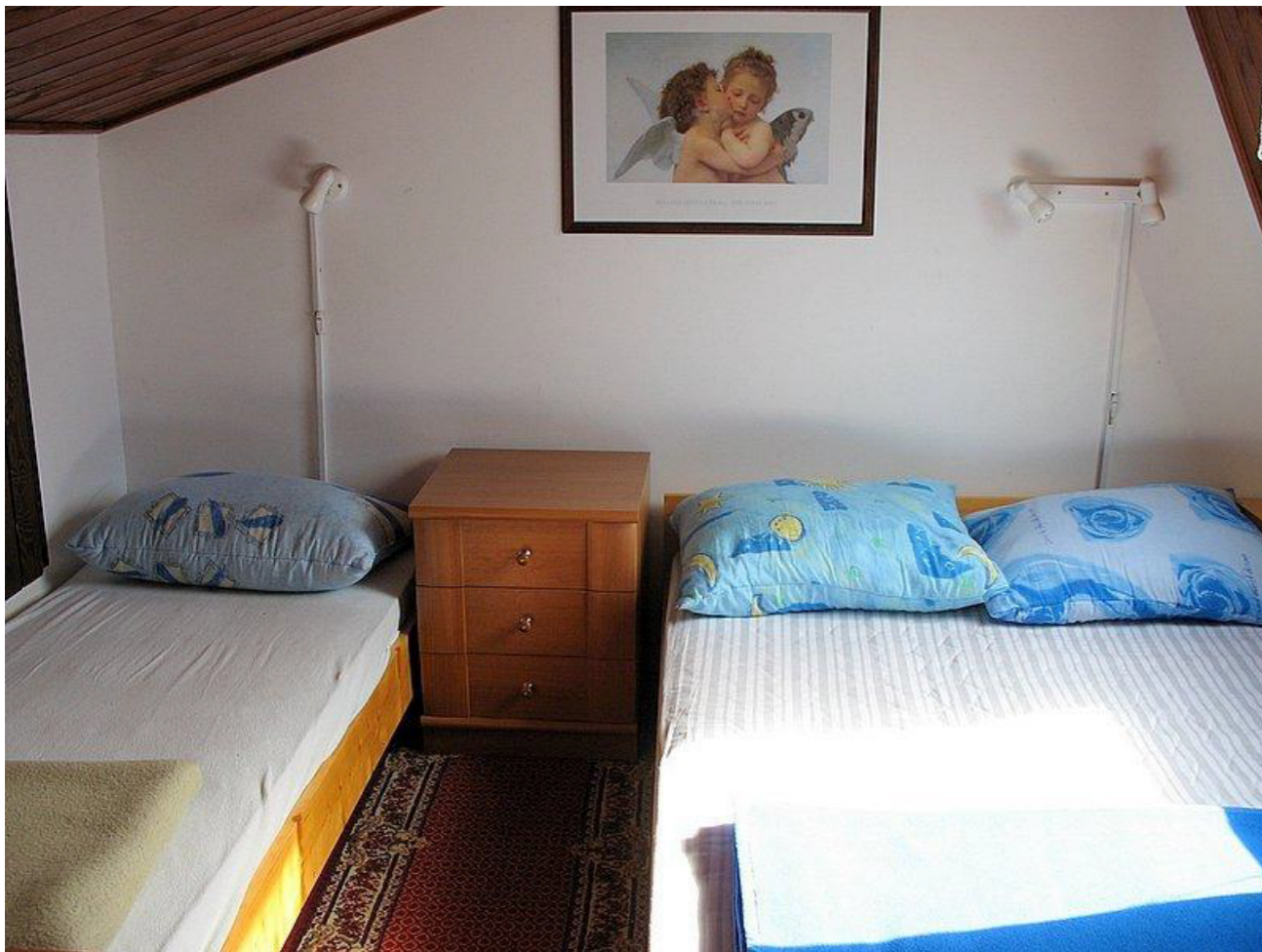
Apartmajska ponudba v občini Bovec