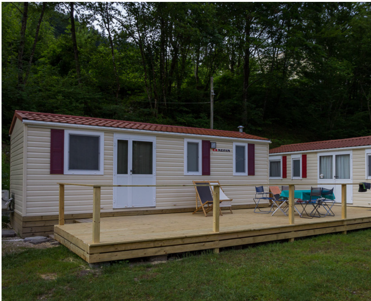
Obstoječe mobilne hiške Adria mobil